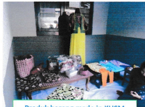
Produk barang made in KUSM