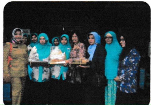
Peninjauan oleh Metri Pemberdayaan Perempuan