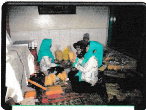
Produk makanan made in KUSM