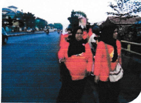
Gerakan Pungut Sampah